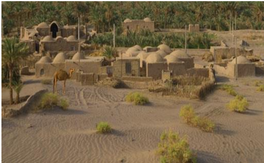
تصویر ۲- نمایی از خانه‌های گنبدی دهسلم